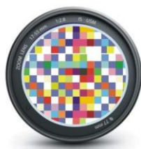
FOTO CLUB STICHTSE VECHT